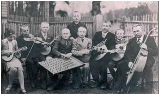
Vahtsõliina algkooli noorõ pillimängjä 1930. aastil.

selts, Kahkva segäkuur. Kahkva laulukuur käve kokko jo 1890. aastagast. Mitmõst perrest tull laulma peris mitu inemist: Helpe puult säidse, Noole perrest viis ja Ravva puult neli. Käüti Petseri ja Võro maakunna laulupäivil ni tuuaigsõn Orava vahtsõn seldsimajan. Mitmõ koori pääle kokko tull pia 100 lauljat. Orava haridusseldsi rahvas tekk häämeelega näütemängõ, kõvõmba näütemängutegijä olli Siilbaumõ perrest.