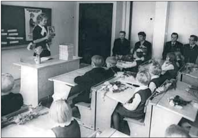
Edimäne koolipäiv Vahtsõliina keskkooli vahtsõn majan 1975. aastagal.

Mu esä ja timä vanõmba es olõ jalagagi kuuli saanu. Midä nää tiidse, oli opnu esi koton. Nii tekk esä ka mukka, ku ma viieaastadsõs sai: opas lugõmist, kirotamist ja pääst arvamist. Kirotamisõs papõrd raisada es anda. Edimäst kõrda proovõ kirotata hüdsega puulavvakõsõ pääle. Säält oll lihtsä tuud jälki maaha pühki. Mina ja töösõ mii kandi poiskõsõ tarvidi hüdse asõmõl parõmba meelega