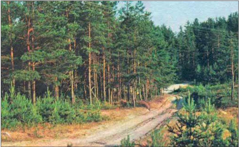
Palopäälne Piusa veeren.