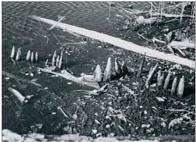
Muistinõ lövvüs – kaidsa.

Et loodsigu vannust teedä saia, võeti tuu külest proovitükk. Teti selges, et Kisõjärve loodsigu vannus või olla esiki 870+–70 aastakka. A loodsiikut es kannahtha kaemisõs vällä panda. Nii lasti tuu järve tagasi.