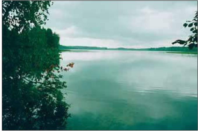
Kae üle Hino järve!