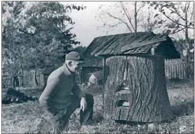
Vana pakttaro Tasatsõ talon.