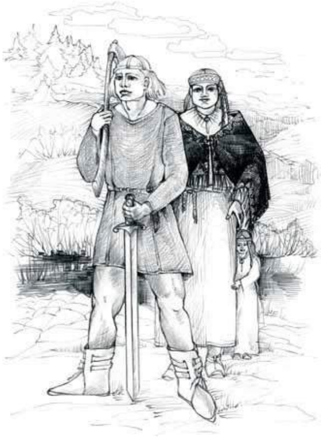
Misso miis pidi umma vapa põlvõ ja pereht kaitsma.

Tüütsmäe kolgan Tilga ja Utike külä piiri pääl om Ilmamägi. Tuu kandi inemise omma arvanu: «Siist korgõst om terve ilm nätä.» Ilmamäe lähkühe jääs Tammõtsõör. Mõlõmba kotusõ om-