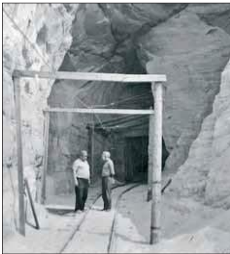
Liiva vidämise raudtii Piusan 1970. aastil.

Klaasitüüstüse jaos om kõgõ parõmb valgõ liivakivi. Tuud kaibõtas täämbädseni Piusa liivakaivandusõst. Vai nigu rahvas ütles - liivahavvast. Irboska aktsiaselts Gips nakas jo 1924. aastagal tan liiva kaibma.