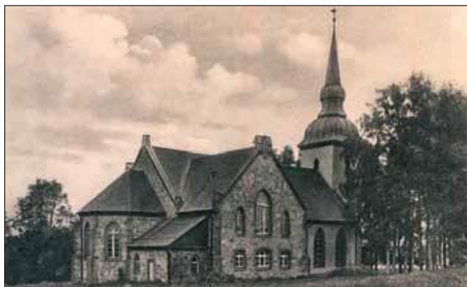
Vahtsõliina maakivist kerik.

KALMUAIDU OM VAHTSÕLIINAN OLNÜ VÄHÄMBÄLT NELI: kats peris vanast aost ja kats vahtsõmbat. Peris vanno kalmõ pääle om mõts kasunu.