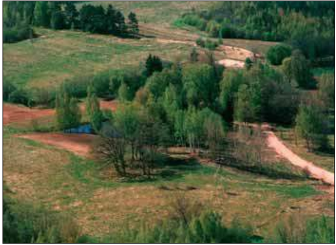
Utike külä nurmõ, iin keskpaiigan Tammõtsõõr.

Mille Tammõtsõõr? Sääl kasus tsõõrin säid- se pia 200 aastaga van- nust tammõ. Arvatas, et nuu paiga omma vana ohvrikotusõ. Ohvriid tuudi sis, ku hääd saaki ja eläjakas- vu loodõti vai taheti tukõ hindä elo ja te- gemiisi hääs. Kuimuu- du ja kinkalõ ohvriid tuudi, ei olõ teedä.