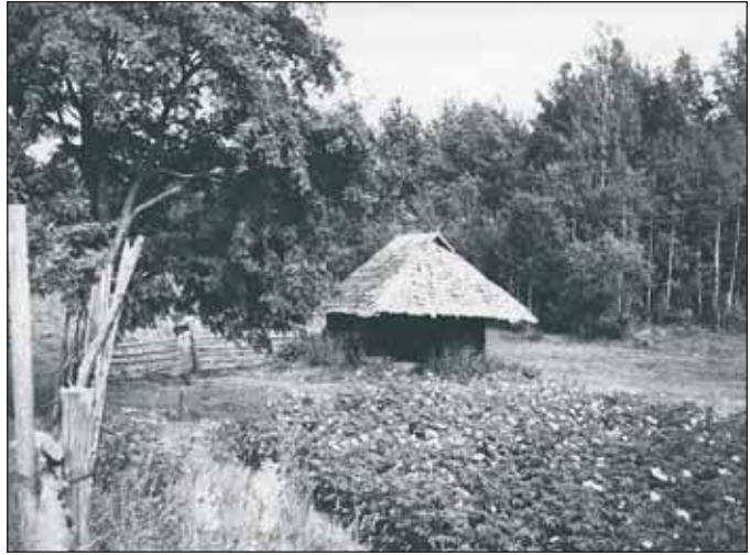
Vana sann Kurõ külän.

päält tulõva tunni ja päävä täüs, peräst saa- va täüs ka nädäli ja aasta. Piagi om kogo elo tuust tsilkmisõst kuhani kuurman. Sis lüvväs mahlatamisõlõ punn ette... Ja nii omgi inemise käest kõik timä osa ärä tsilknu.