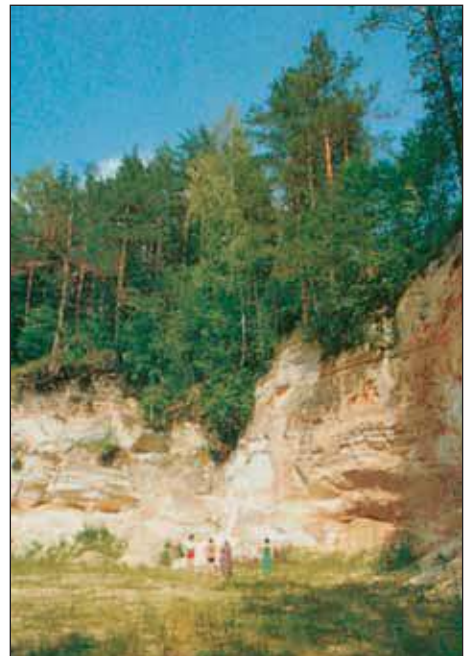
Härmä mäemine müür.

Härmä külä all om Eesti kõgõ korgõmb jõõmüür – Härmä Mäemäne müür vai Keldre müür (43 m). Härmä Alomast vai Kõlksniidü müürü peetäs umakõrda väega ilosas. Liivakivi näütäs sääl meile ummi