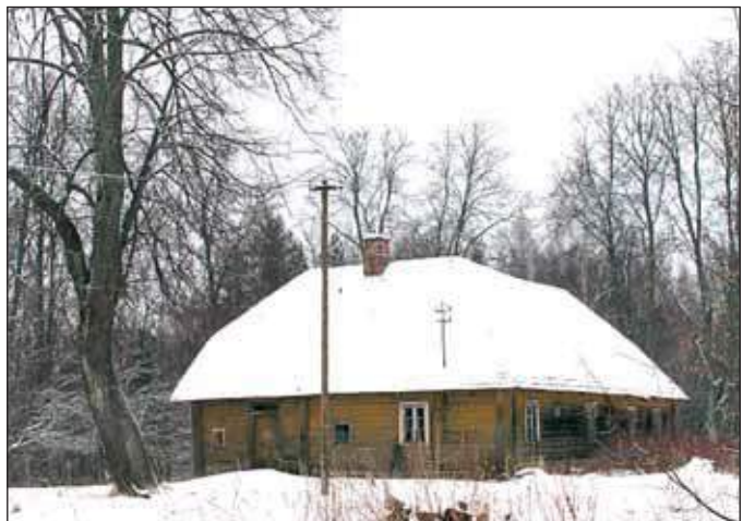
Pääväkese talo seo ilma aigu.

Orava mõisa Pääväkese talo nr 25 müüdi Asti Viidrikulõ. Kõrraga es saa maad vällä osta, selle et maa hind oll ülekohtodsõlt korgõ. Pia neli tuhat hõpõruublit. Vanalõ peremehele, Lasva mõisa üüvahilõ