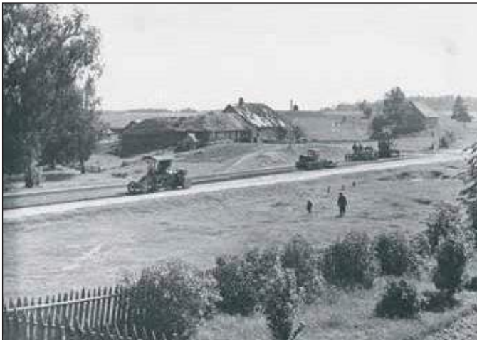
Kivitii asfaldi ala pandminõ 1950. aastil.