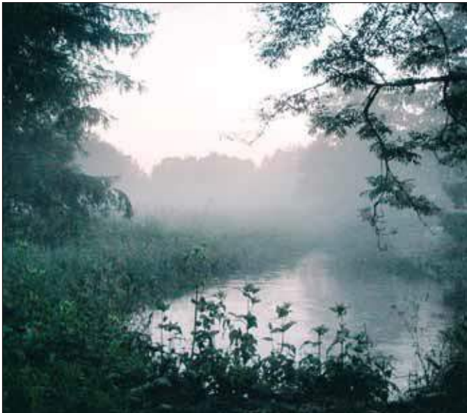
Varra hummogu Piusa veeren.

Ku Misso ümbre tasadsõ maa pääl kasus inämbüste lehepuumõts, sis Piusa-Tabina palo pääl omma suurõ pedäjämõtsa. Suurõmba suu jääse Orava mõtso sisse, vasta Setomaad Mädäjõõ viirde ja Misso nulka vasta Lätimaad.