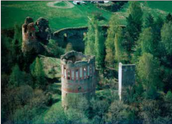
Vahtsõliina kants mii päivil.

1342. aastagal tetti siia kivist kants. Kantsi lasketi Tarto piiskopi mii vana maaliina asomõlõ. Tuu sai kõgõ kimmambäs kindlusõs vasta Vinne piiri. Kantsi ümbre tegüsi ka väikene küläkene. Tuud häõti mitu kõrda üle käünü võõra väe.