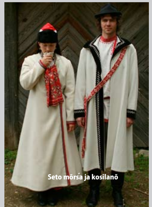
Seto mõrsā ja kosilanõ