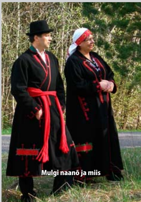
Mulgi naanõ ja miis

Mulgi' uhkõndõlõsõ' ummi mustõ kuubõga nii Mulgimaal ku päälinan, naabri' seto' omma' kavvõst är tunda' valõtavidõ härmākide perrā. Pia nakkasõ' võrokõsõ' kah nätä' olõma – näü-tuses tõsõl Umal Pidlõ oll' joba ütsjago võrokõi-si hahku suursärkega.